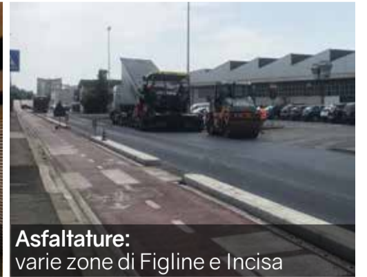
Asfaltature: varie zone di Figline e Incisa