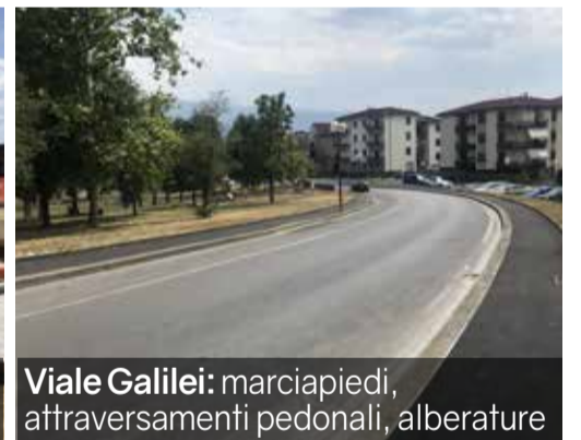
Viale Galilei: marciapiedi, attraversamenti pedonali, alberature