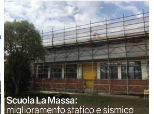
Scuola La Massa: miglioramento statico e sismico