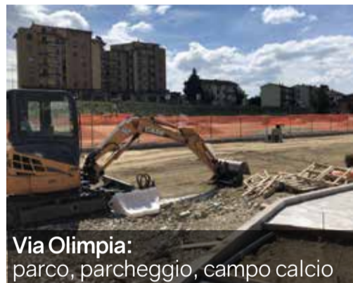
Via Olimpia: parco, parcheggio, campo calcio