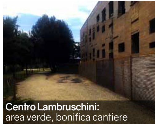
Centro Lambruschini: area verde, bonifica cantiere