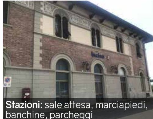
Stazioni: sale attesa, marciapiedi, banchine, parcheggi